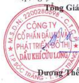
Dương Thế Nghiêm