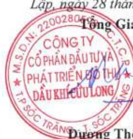
Dương Thế Nghiêm