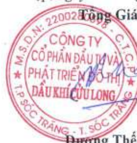
Đương Thế Nghiêm